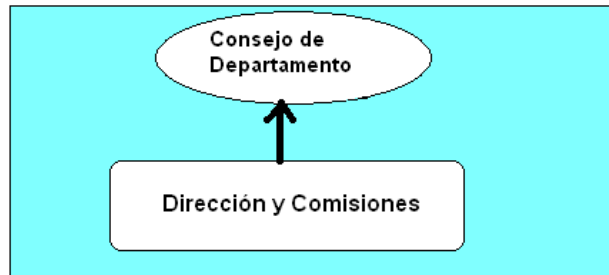
Figura 2. Relación Comisiones, Dirección y Consejo.

Cumpliendo con el artículo 103 ("De las Comisiones") del Reglamento de gobierno y Administración de la Universidad de Cádiz , cada Comisión será constituida por la Dirección del Departamento, con la composición y elección de miembros que se considere oportuna (según la demanda de participación existente), con sus normas de funcionamiento, y con sus normas de régimen interno. Una vez constituidas, se llevarán a Consejo de Departamento para su aprobación. Para garantizar la participación de todos los estamentos en la Comisiones, cada una de ellas deberá tener representación de PDI, PAS y alumnos.